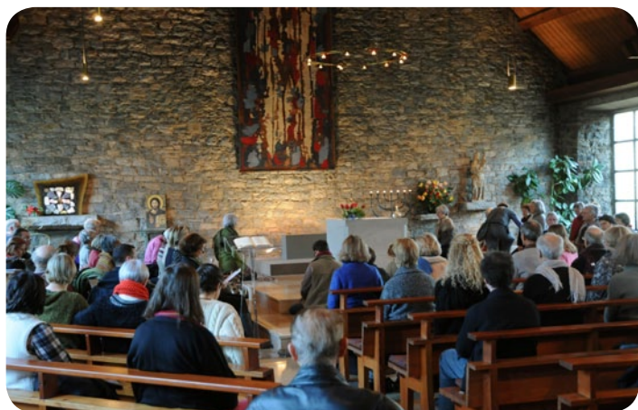
La chapelle : un mur de pierres nues, une tapisserie lumineuse.