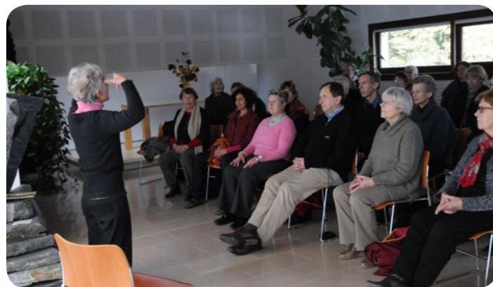
L'atelier "conscience de soi" : le plus sûr moyen d'atteindre l'intériorité