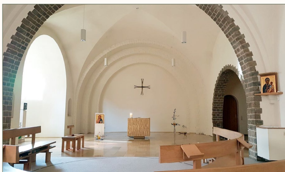
La chapelle du monastère